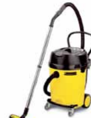
NT 65/2 Eco

De vlakfilter is door het opklapbare filterdeksel comfortabel toegankelijk.