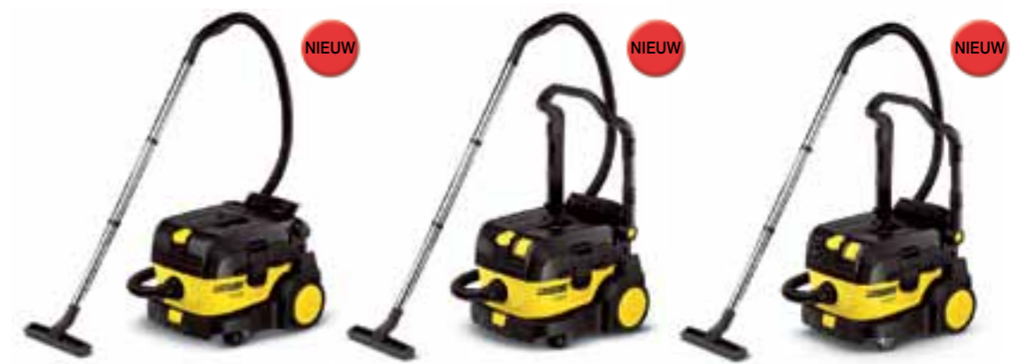
NT 14/1 Eco

Niet bukken, niet slepen. De praktische beugelhandgreep maakt de NT 14/1 tot een trolley voor een comfortabel transport naar de plaats waar de machine moet worden gebruikt.