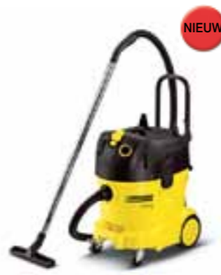
NT 40/1 Tact Te