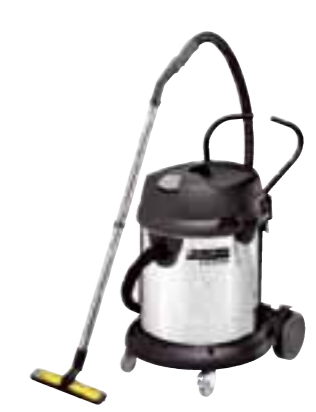
NT 65/2 Eco Me