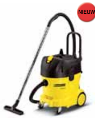
NT 40/1 Tact

In de nieuw vormgegeven opbergmogelijkheid voor toebehoren is alles veilig en goed beschermd opgeborgen – zelfs wanneer het er op de bouwplaats ruig aan toegaat.