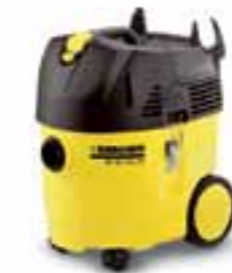
NT 35/1 Tact Bs

Bestaande uit: oliebestendige zuigslang (4 m), metalen vloerzuigmond en Geka-C-afvoer-koppeling met afsluitkraan.