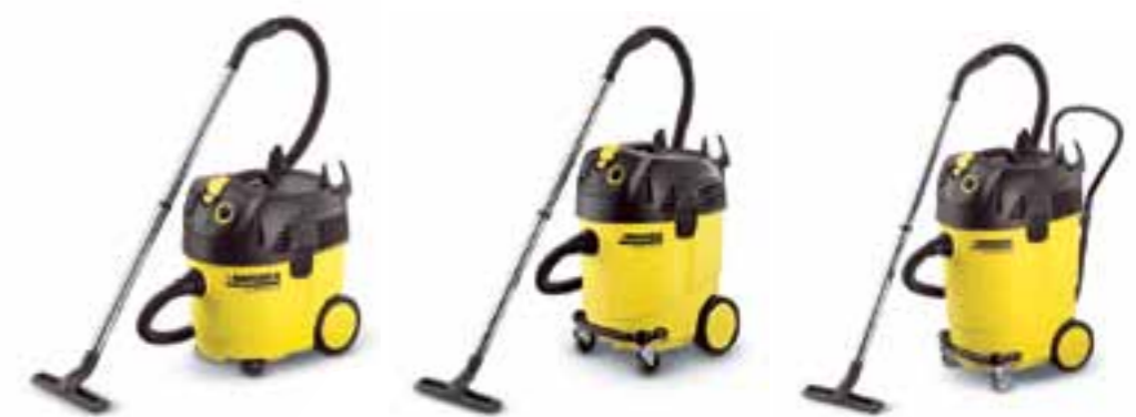
NT 35/1 Tact Te

De traploze toerentalregeling maakt in een handomdraai de individuele zuigkrachtinstelling mogelijk.