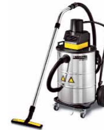
NT 80/1 B1 M

NT 80/1 B1 M/MS Voor brandbaar stof in de stof-explosieclassen in zone 22 en gezondheidsbedreigend stof uit de stofklasse M.