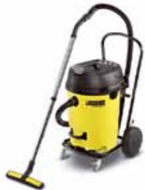
NT 65/2 Eco Tc

Machines van de Tc-versie zijn gemonteerd op een kantelbaar onderstel, waarmee het vuilreservoir zonder problemen kan worden geleegd.