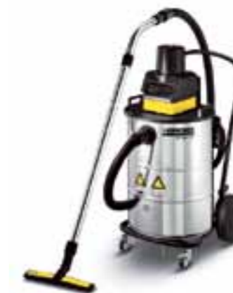
NT 80/1 B1 MS