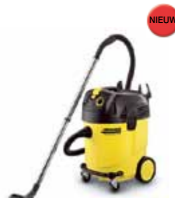
NT 45/1 Tact Te Ec