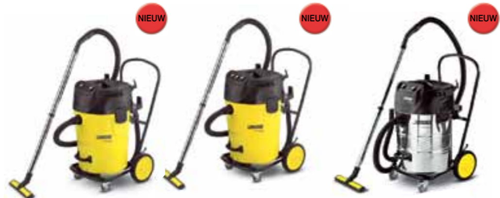
NT 70/2 Tc

De zuigerkop kan gemakkelijk op het patronenfilter met groot filteroppervlak worden neergezet. Het geïntegreerde vlottersysteem onderbreekt tijdens het opzuigen van vloeistoffen de luchtstroom, zodra het reservoir vol is.