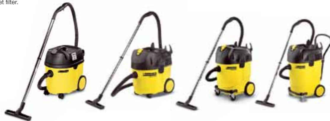
NT 361 Eco

Het volledige toebehoren kan rechtstreeks op de machine worden opgeborgen. Voor de zuigslang en de stroomkabel zijn twee ophanghaken beschikbaar.