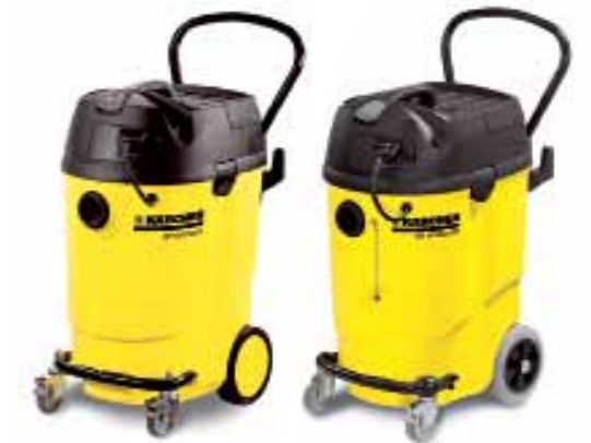
NT 55/1 Tact Bs