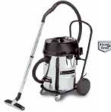
NT 72/2 Eco Tc